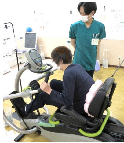
ニューステップ :全身運動・体力向上