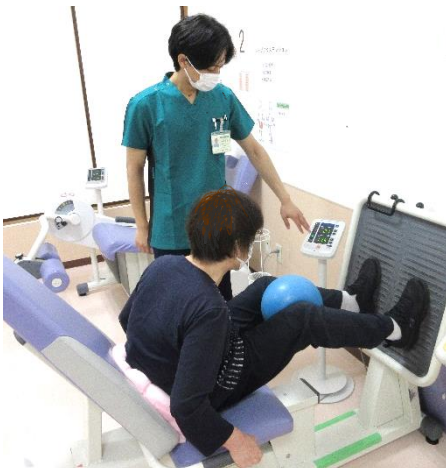
レッグプレス :足の筋力強化